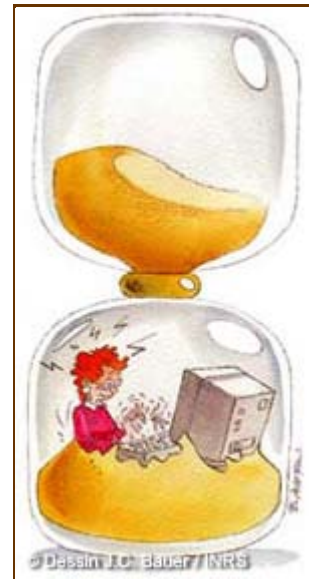
le poids du temps

La pression du temps est un autre facteur de stress important, qu'il s'agisse de travail sous de courts délais ou de travail interactif en cas de pannes ou de lenteurs de l'ordinateur.