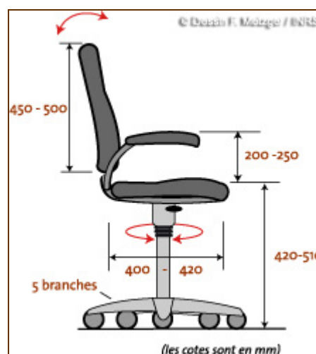
schéma d'un fauteuil ergonomique conforme à la norme NF EN 1335-1

Les sièges avec appui sur les genoux sont à proscrire, à moins d'une utilisation très ponctuelle, car ils entraînent des problèmes de circulation sanguine dans les jambes.