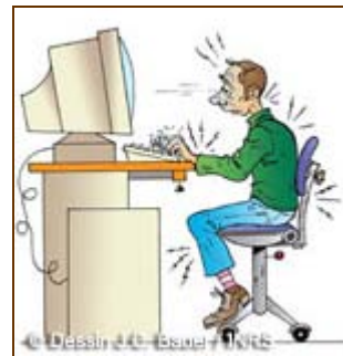
La posture favorite des TMS

Le travail sur écran impose une posture statique pendant de longues périodes. Ce phénomène engendre d'autant plus de troubles musculo-squelettiques douloureux (tendinite, ténosynovite, syndrome canalaire) que la posture est peu ergonomique. Les muscles et tendons touchés sont essentiellement ceux de la nuque, des épaules, de la région lombaire, des poignets et des mains. Le syndrome du canal carpien (SCC) est la pathologie la plus connue et la plus répandue : il s'agit d'une inflammation du nerf carpien due à sa compression au niveau du poignet. Les femmes sont plus touchées que les hommes, ainsi que les personnes souffrant d'obésité.