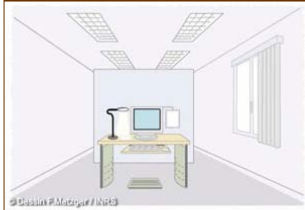
Implantation d'un poste de travail avec écran, d'après "le Guide de formation" de l'université de Laval, 2000, p. 41

Il est en général possible d'implanter un poste de travail comprenant un ordinateur de façon adéquate, et ce quelle que soit la configuration de la pièce. Il convient pour cela d'étudier l'éclairage, ainsi que l'environnement sonore et thermique.